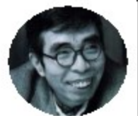
故井上ひさしさん

また「グローバルな安全保障課題」への対応などとして、自衛隊が米軍と共同して、海外での戦