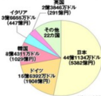
米国の同盟国が負担する米軍駐留経費(2002年)